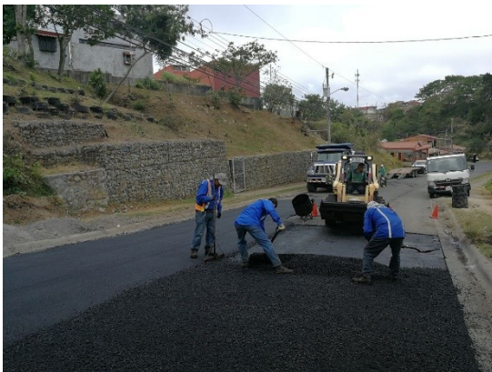
Imagen 5 Colocación de MAC en la salida de Lomas de Cabeara