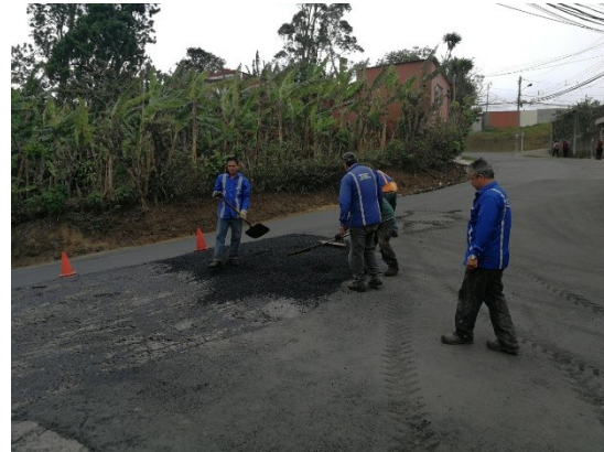
Imagen 7 Colocación de MAC en la salida de Lomas de Cabeara