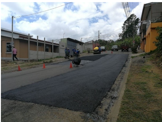
Imagen 6 Colocación de MAC en la salida de Lomas de Cabeara

Hagamos de Moravia una verdadera comunidad