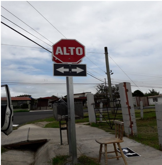
Imagen 4 Señal vertical entronque Calle Nueva y Calle La Torre