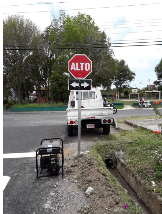
Imagen 3 Demarcación vertical Calle La Torre