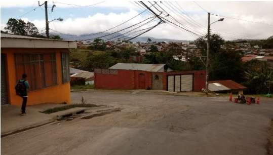
Imagen 1 Reparación salida lomas de Cabeara a terminal AMSA